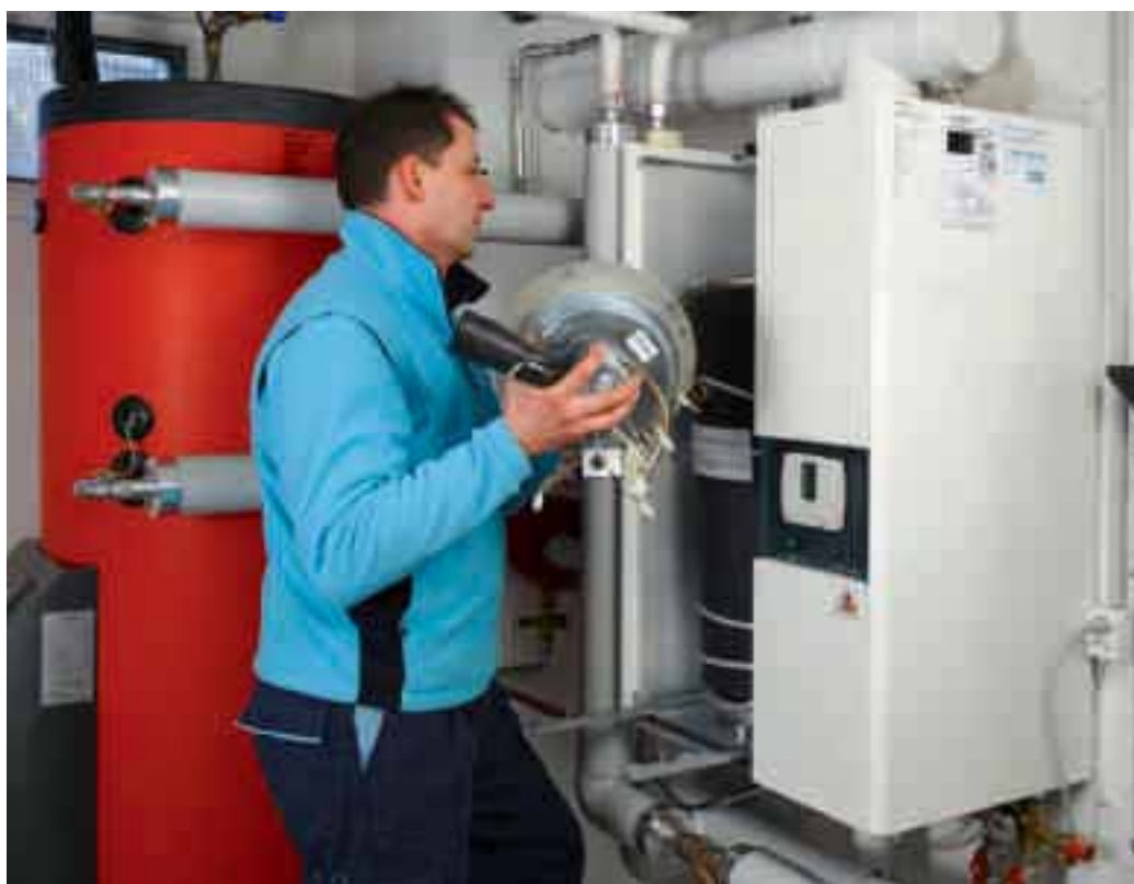
Die von Euw AG Heizungen aus Grüningen setzt...