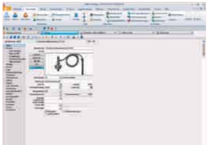
... durch Produkt, Dienstleistung, Individualanpassung und Preis überzeugt.

im Lager bereits leer war – mit möglichen negativen Auswirkungen auf die Liefertreue, da ein Auftrag wegen fehlendem Material durchaus einige Tage liegen bleiben konnte.